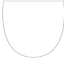
(Nacrtaj grb razreda)

Ugovor izradite po danom predlošku na papiru formata A4 i kopirajte ga u onoliko primjeraka koliko vas je u razredu.