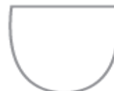
Nacrtaj grb razreda